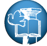
ΠΑΙΔΑΓΩΓΙΚΟ ΙΝΣΤΙΤΟΥΤΟ ΚΥΠΡΟΥ