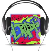
ΕΠΙΣΤΗΜΟΝΙΚΗ ΕΤΑΙΡΕΙΑ «European School Radio, Το Πρώτο Μαθητικό Ραδιόφωνο»